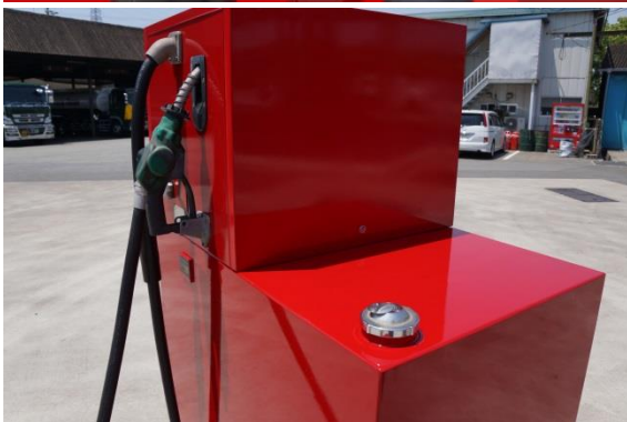
給油口 ノズルによる燃料補給にも対応