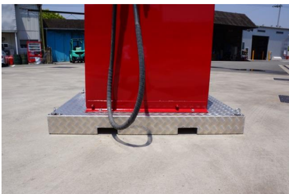
フォークリフトに対応した架台