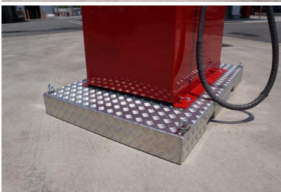
地盤固定用アンカー穴